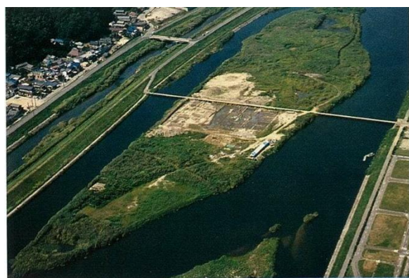
草戸千軒町遺跡全景